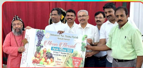
Harvest Festival Raffle Coupon Release