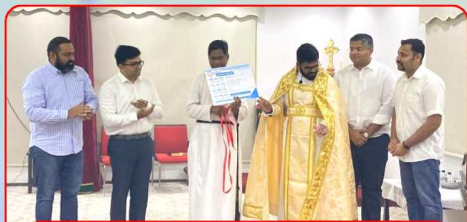
Yuvajanasakhyam 2023-2024 Activity Inauguration